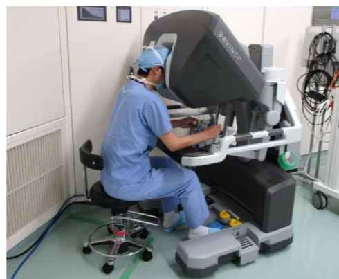
(写真3) サージョンコンソールからの操作