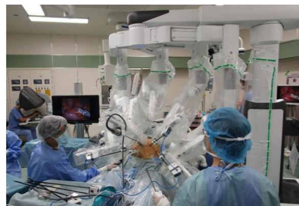
(写真2) ロボット手術の風景

ロボット手術では、サージョンコンソールと呼ばれる操作装置から術者が内視鏡用手術器具を遠隔操して手術をします（写真②・③）