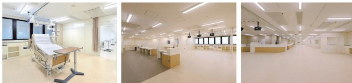
特定集中治療室(ICU) ハイケアユニット(HCU) 救急集中治療室(ECU)

重症患者の高度医療を効果的に行うため、特定集中治療室(ICU)、ハイケアユニット(HCU)、救急集中治療室(ECU)を手術室に近接して一体的に配置したほか、救急医療の強化のため特定集中治療室等を増床しました。血管造影装置を活用した手術が行えるハイブリッド手術室も整備しました。